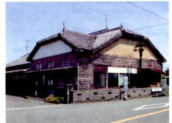
天龍社織物工業協同組合