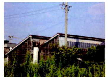
織物工場の「のこぎり屋根」