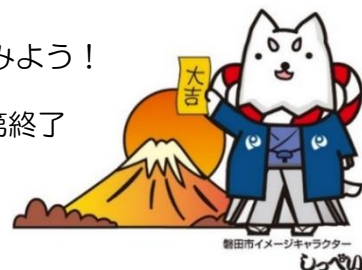
磐田市イメージキャラクター しっぺい