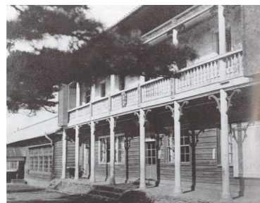
井通尋常高等小学校（旧西之島学校）校舎