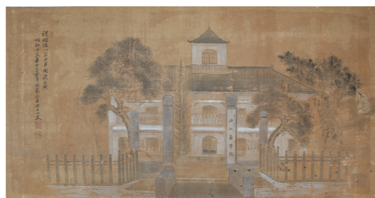
絹本着色西之島学校図