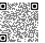
図書館ホームページ