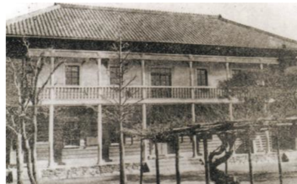
西之島学校校舎『磐田の近代教育』より

みやのいっしき なかだ けごじま えびつか さきはらじま しち 宮之一色、中田、気子島、海老塚、笹原島、下 まんのう たての もりもと かみほんごう しちほんごう あかいけ 万能の一部、立野、森本、上本郷、下本郷、赤池