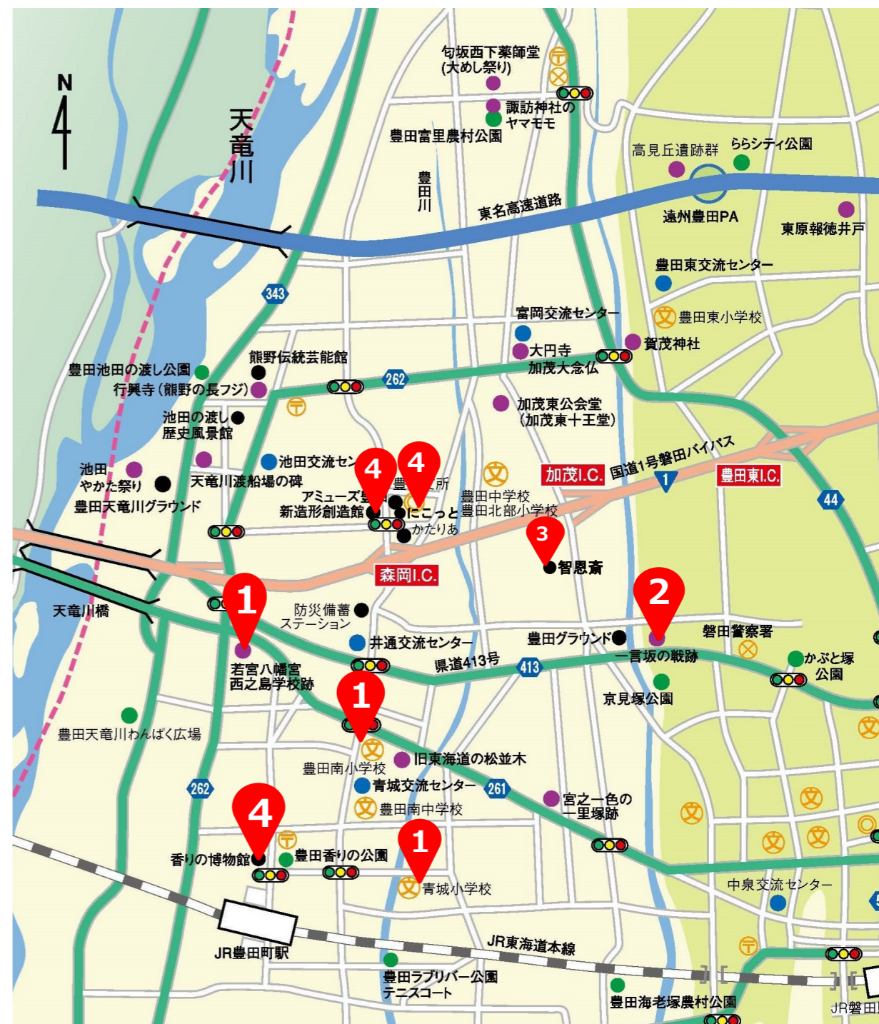
「いわたふるさと散歩（豊田編）」磐田市文化財課より