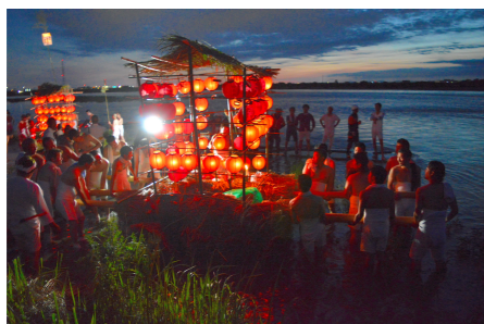
池田やかた祭り（市指定） 『磐田の文化財』磐田市文化財課より

賀茂神社は平安時代の書物に登場する古い神社です。本殿は江戸時代に再建され、当時の建築様式が残されています。祭りのときの供え物の作り方は、京都の上賀茂神社、下賀茂神社につたわる古い様式が今も伝承されており、賀茂神社特殊神饌として市の無形民俗文化財に指定されています。