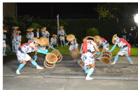
加茂大念仏（市指定） 『磐田の文化財』磐田市文化財課より