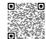
図書館ホームページ

※◆印は図書館ホームページの「発見！いわた」コーナー、 ★印は電子図書館から見ることができます。