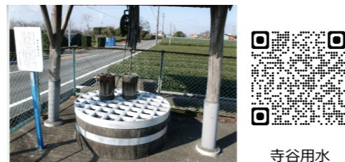
東原報徳井戸（市指定） 『磐田の文化財』磐田市文化財課より

1913（大正2）年、磐田原台地の上で地下水を得るために掘られた深さ45メートルもある井戸です。報徳組織から資金援助を受けたため、この名前がつけられました。