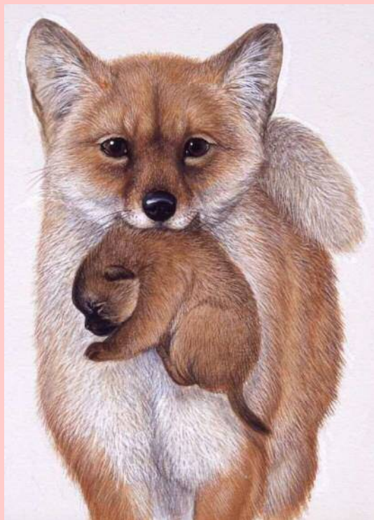
『どうぶつのおかあさん』 藪内 正幸／え 小森 厚／ぶん (福音館書店)